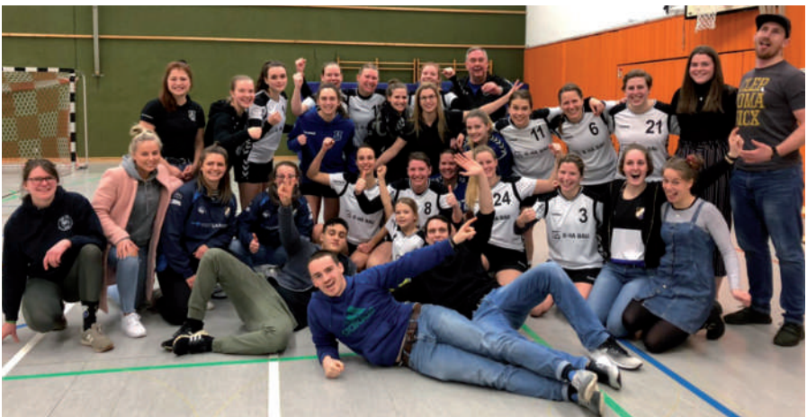
Siegerfoto gemeinsam mit „unseren“ Rugbys nach dem Spitzenduell