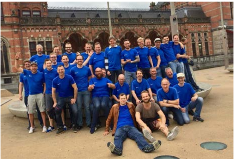
Ganz blau: Die Männer von Germania in Groningen

Dieses traumatische Erlebnis musste bei einer gemeinsamen Teambuildingmaßnahme (Mannschaftsfahrt nach Groningen) erst einmal verarbeitet werden. Mit einem Tross von knapp 30 Leuten machte man sich auf den Weg in die niederländische Kleinmetropole und arbeitete hier sowohl an den Gesangsfähigkeiten Einzelner als auch an der kulturellen Bildung bei durch Stadtrundgänge.