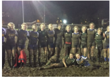
(Das Team nach dem Turniersieg in Kiel)

Unsere Rugby Mädels beendeten die Hinrunde der Frauen 7er Nordliga im November 2017 mit einer grandiosen Schlamm Schlacht in Kiel. Dabei konnten sie nicht nur den Nordrivalen St.Pauli schlagen, sondern auch ein starkes Finale gegen Göttingen abliefern.